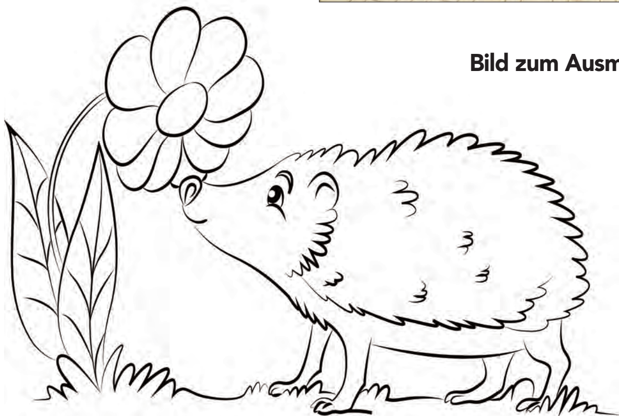
Bild zum Ausmalen