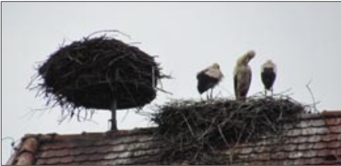
Inzwischen beseitigtes Nest neben dem Traditionsnest auf der Pfarrkirche

Viele Bürgerinnen und Bürger haben sich in den Wintermonaten am Anblick der vielen überwinternden Störche vor allem auf dem Dach der Pfarrkirche erfreut. Das waren nicht nur hiesige Störche, sondern auch fremde Individuen, die durch die Burgauer Brutstörche angelockt wurden und „hängen geblieben“ sind. Zusammen mit den inzwischen zurückgekehrten Zugstörchen ist somit die Population in Burgau weiter angewachsen, erste Nestbauversuche an neuen Plätzen lassen sich bereits beobachten.