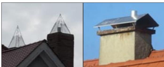
Abweisermodelle für Kamine

Zusammen mit der Stadtverwaltung und engagierten Bürgern ist für das mittlerweile beseitigte dritte Nest auf dem Kirchendach Ersatz geschaffen worden: Auf dem Grundstück von Christian Doll, Bienenstiftung Burgau, ist an der Bleiche