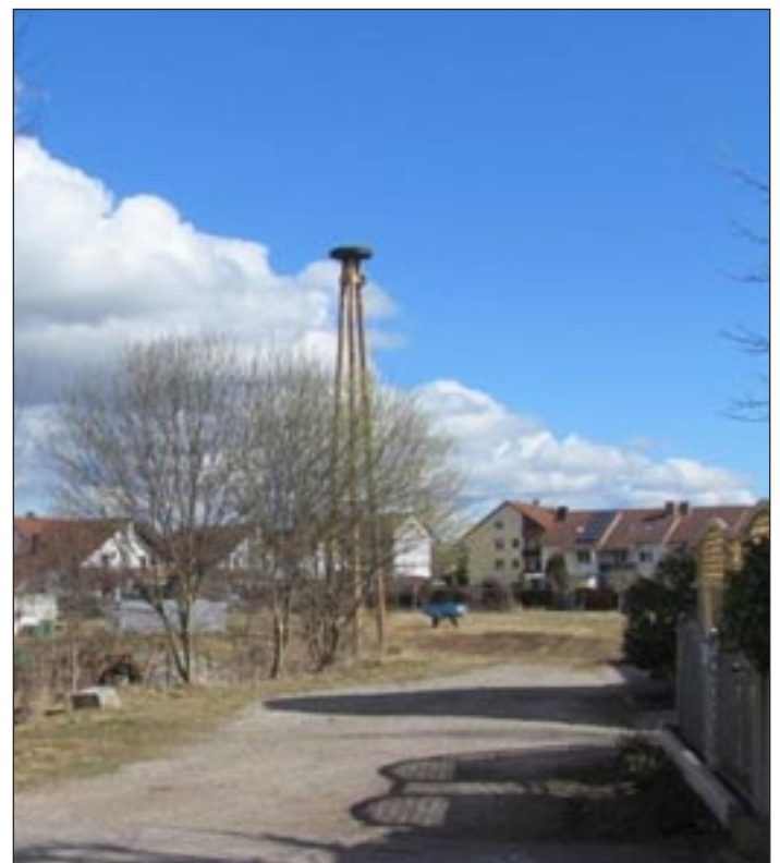
Neuer Neststandort an der Bleichwiese

untere Naturschutzbehörde, Landratsamt Günzburg