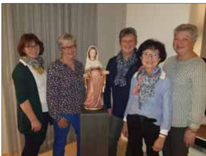
Die Vorstandschaft des Katholischen Frauenbundes Burgau freut sich über die neue Madonna.