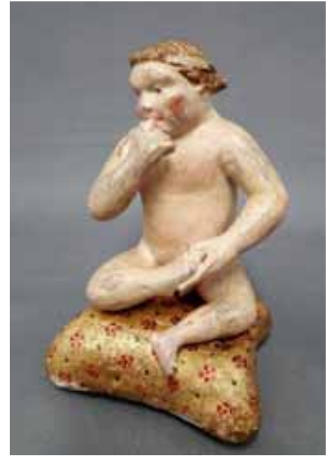
Ältestes Jesuskind, um 1300, im Krippenmuseum in Mindelheim

Die Realität wollte man bei Jesus, dem Sohn Gottes, ausblenden.