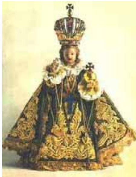
Prager Jesulein, 16. Jahrhundert

Die Darstellung des Jesuskindes erfolgte seit dem 15. Jahrhundert in vielfältiger Weise, zum Beispiel als etwa einjähriger Knabe, stehend und prunkvoll angezogen. So ist auch das berühmte Prager Jesulein ausgeführt. Oder als sogenanntes "Fatschenkind", nackt, kostbar gewickelt und unter einem Glassturz. Das war auch die Zeit, in der die Darstellung des Christkindes von der Weihnachtsgeschichte losgelöst erfolgte.