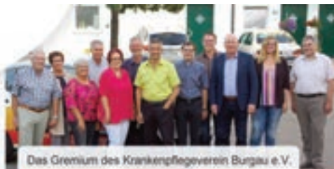
Das Gremium des Krankenpflegeverein Burgau e.V.

Vermittlung von einem privatem Hausnotruf