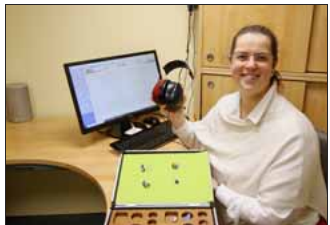
Das Hörstudio Burgau ist eines der wenigen Akustikgeschäfte, das das komplette Programm für gutes Hören bietet. Und dies mitten in Burgau.

Hörstudio Burgau Stadtstraße 41, 89331 Burgau Telefon: 08222 / 96 18 40 E-Mail: info@hs-burgau.de Internet: www.hs-burgau.de