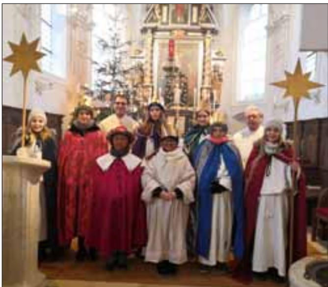
Die Limbacher Sternsinger liefen am 5.1. in ihrem Dorf