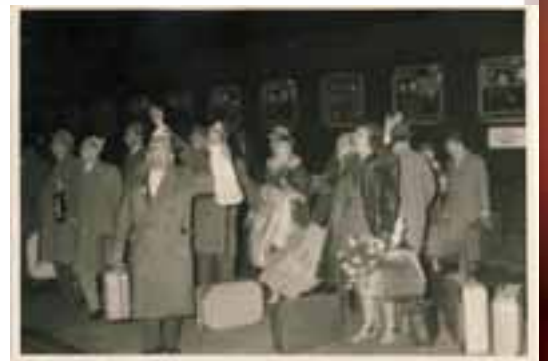
Die Burgavia am Bahnhof in Burgau am Montag, den 6. Februar 1961