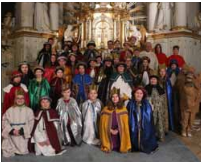
Die Sternsinger aller Pfarreien bei der Aussendung am Neujahrsgottesdienst in Burgau mit ihrem Kamel