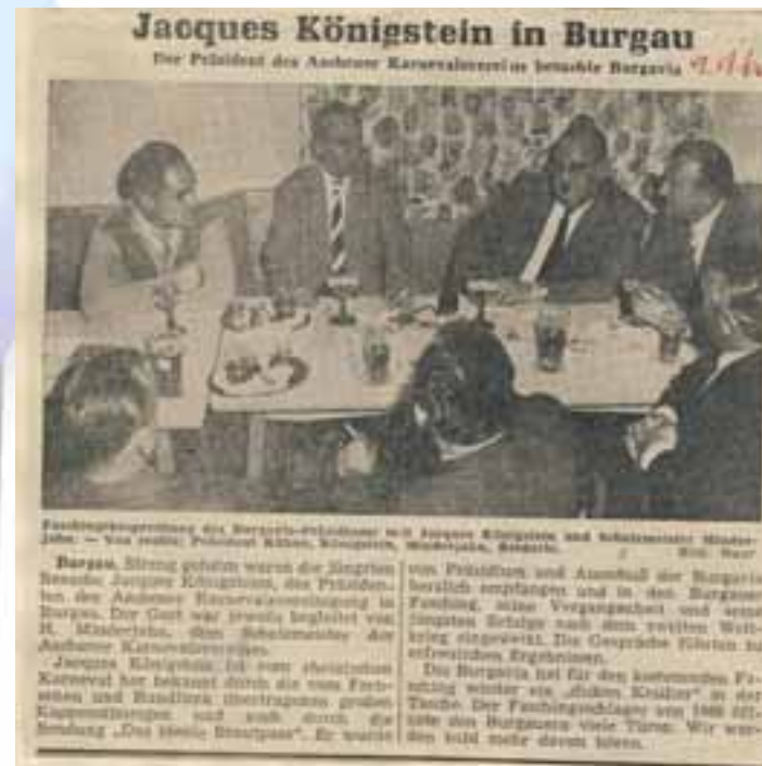
Die Delegation aus Aachen zur Prüfung des Vorschlags Zeitungsbericht vom 09.11.1960

Daraufhin kam noch 1960 eine Kommission des Ordenskomitees aus Aachen nach Burgau. Sie inspizierte das Städtchen genau und wollte auch wissen, ob dies ein ernst zu nehmender Vorschlag wäre und kein billiger Schabernack.