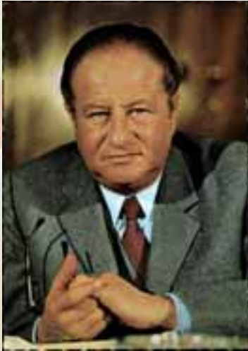
Dr. Bruno Kreisky (1911-1990) Außenminister und Kanzler Österreichs