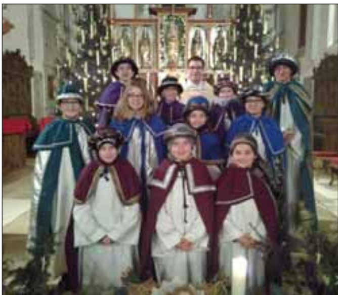
Die Unterknöringer Sternsinger im Dreikönigsgottesdienst am 4.1.