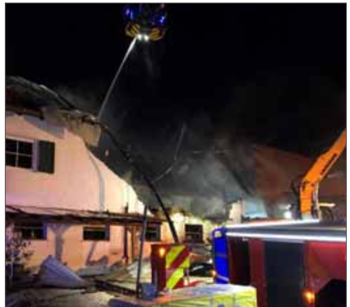
04.11.2019, 17:39 Uhr Brand Landwirtschaft in Kleinbeuren