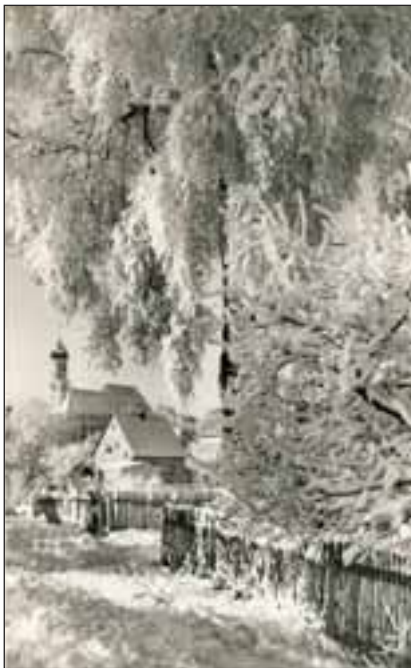
Burgau in den 1950er Jahren

Irmgard Gruber-Egle, Historischer Verein, Burgau Stadt und Land e. V., Bilder und Text urheberrechtlich geschützt, kopieren und vervielfältigen nur mit Genehmigung der Urheberin