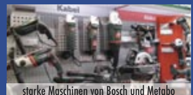
starke Maschinen von Bosch und Metabo