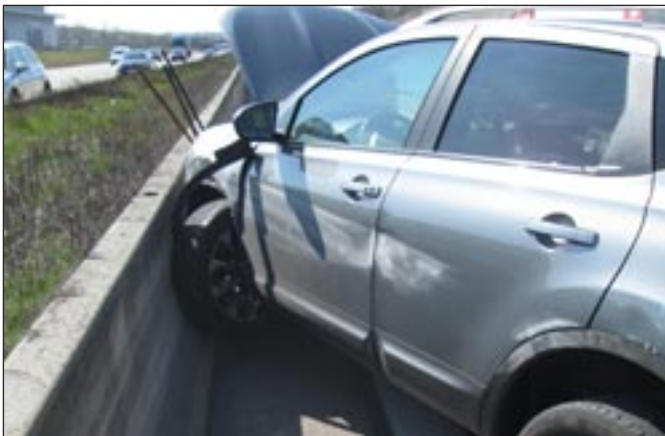
29.03.2019, 13:04 Uhr, Verkehrsunfall mit PKW auf der A8