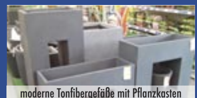
moderne Tonfasergefäße mit Pflanzkästen