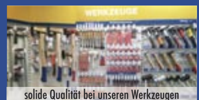
solide Qualität bei unseren Werkzeugen