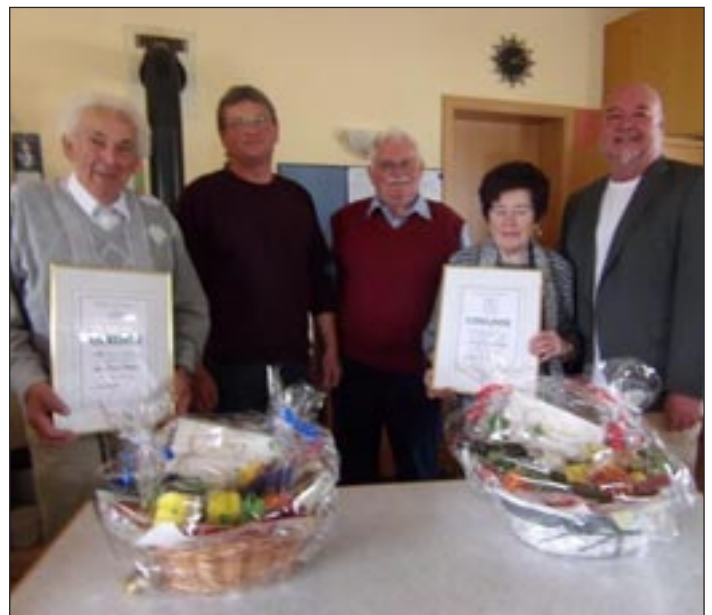
auf dem Bild von links nach rechts:

Wie jedes Jahr gab es anschließend Kaffee und Kuchen auf Kosten des Vereins.