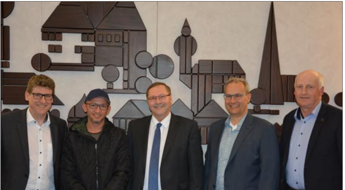
Konrad Barm Erster Bürgermeister