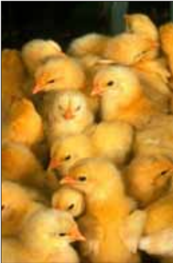
Des send Bieberla ...

Wenn i so ans Frühjaur denk, dann fallat mir au dia Bieberla ei, die alle Kleintierhalter ond Baura früher auf Oschtra ghatt hand. Entweder ma hat se sell ausbrüda lau oder von ebber z'Burga oder rund um Burga kauft. Mir hand se allaweil beim Schmucker kauft, z'schert en Uderkneringa donda ond nau später doba em Bremadaul.