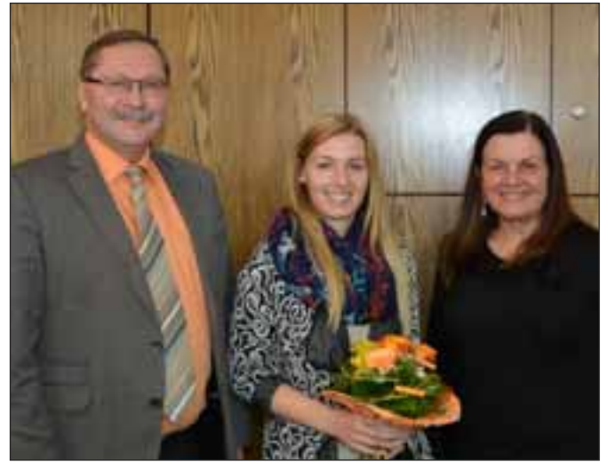
Konrad Barm Erster Bürgermeister