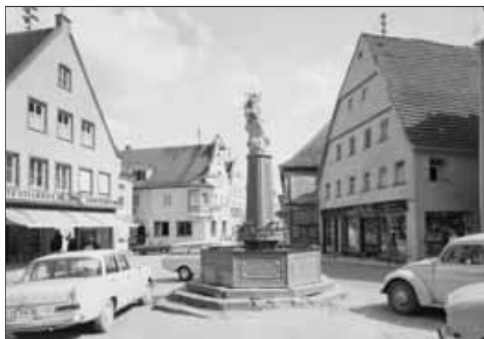
„Wildes Parken im Wirtschaftswunder – das Auto prägt das Stadtbild“

Die 1950er Jahre in Burgau sind geprägt vom Aufbauwillen der Bevölkerung nach dem 2. Weltkrieg. Deutlich wird dies daran, dass Burgau sich in diesen Jahren enorm entwickelte, sei es dadurch, dass die Stadt aufgrund neuer Wohngebiete wuchs oder sei es durch neue Wirtschaftszweige, die einen gewissen Wohlstand in die Stadt brachten.