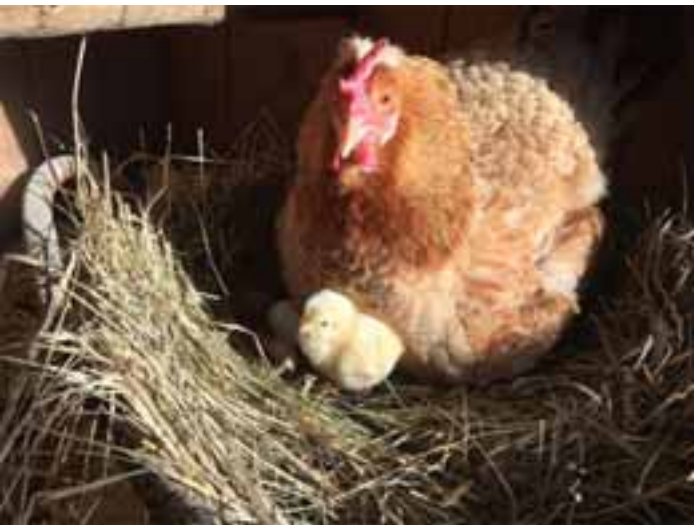
... ond des isch a Brudel

Wenn nau die kloine Bieberla em Haus warat, haba dia no et naus lau kenna, weils meischtens om Oschtra rum no recht kalt war en d'r Nacht. Dia g'kaufta kloine Hehla hand ja koi Brudel ghatt, dia se hätt ondr ihre Flügel nemma kenna.