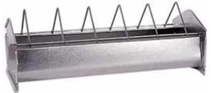
Des isch a Futtertrogl für Bieberla

Des war wie a aufgschnittana halba, kloine Regerinn ond drüber a Draut'stell wo so em a Abstand von vielleicht drei Zentimeter des G'stell a'doilt war, damit dia dann scho greßere Hehla en Reih ond Glied hand fressa kenna.