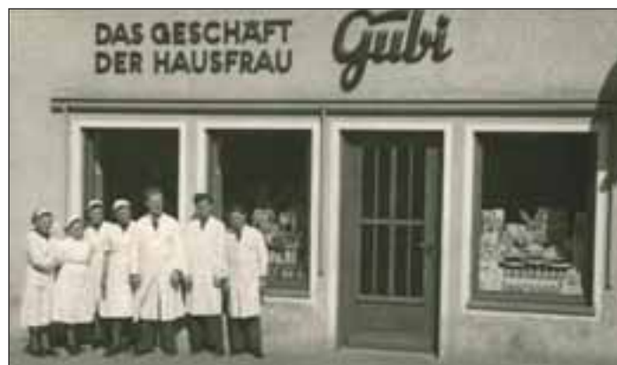
Lebensmittelgeschäft „Gubi“ in der Stadtstraße 1952