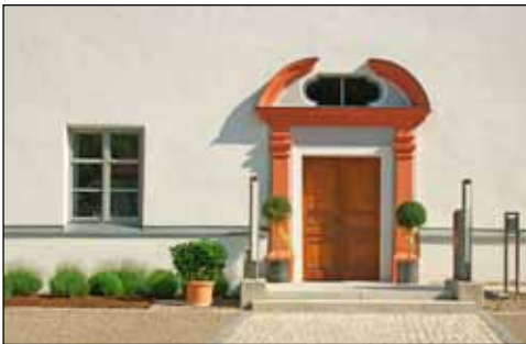
Portal der Kultur: Der Eingang zum Burgauer Schloss

Seit 1907 befindet sich im Schloss das Burgauer Museum, das im Laufe der Zeit immer wieder neu konzipiert wurde.