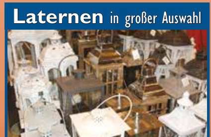
Laternen in großer Auswahl

LED-Metallstern 59,95 € Leuchtsterne LED ab 89,95 €