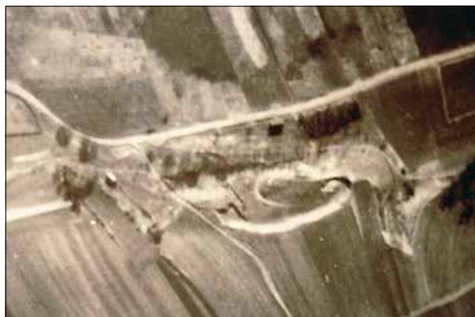
Stark vergrößerter Ausschnitt aus einer Luftbildaufnahme vom 11. April 1944, der die rundliche Topographie der Kiesgrube im Zentrum des Bildes zeigt