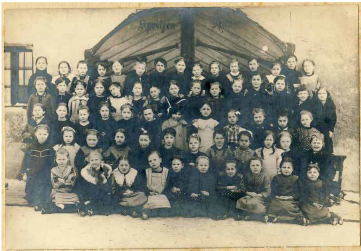
Wahrscheinlich mehrere Mädchenjahrgänge um 1916/1917, aufgenommen im Schlosshof Burgau