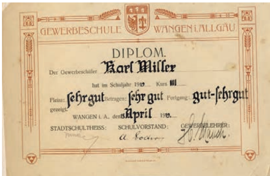
Diplom der Gewerbeschule Wangen, von Karl Miller aus Burgau