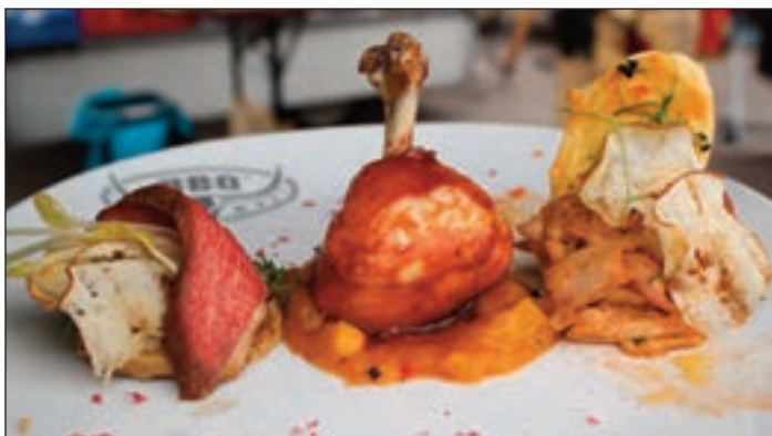
Fingerfood-Dreierlei: Geräucherte Entenbrust auf Hafercracker, Chicken-Lollypop mit Mango Chutney und Pulled Chicken auf Chili-Cracker.