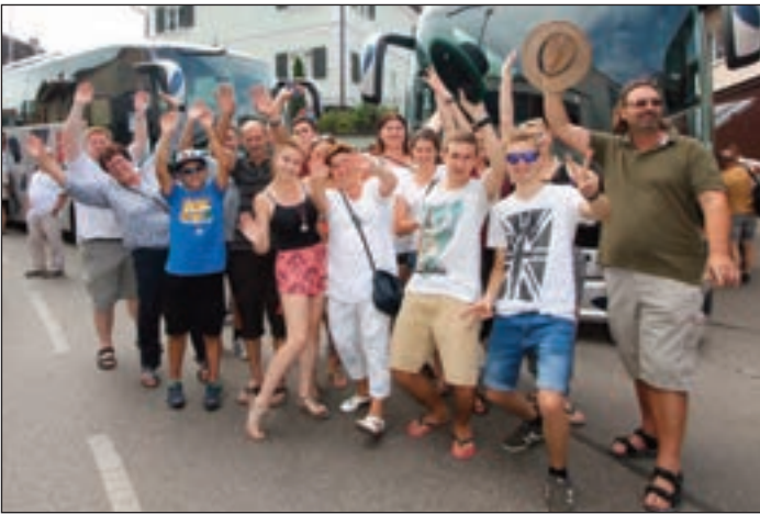
Im vergangenen Jahr waren es die Freunde aus der Steiermark, die mit drei Bussen zum Historischen Fest kamen. Viele nahmen auch am Festumzug teil.