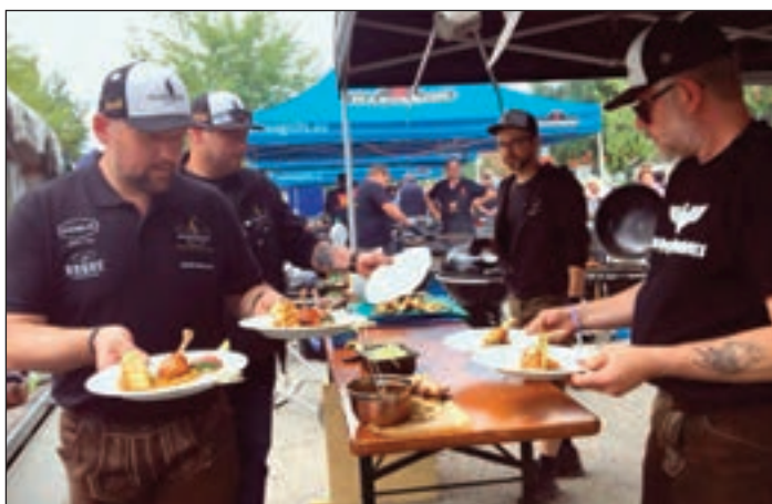
Die Boandlkramer bei den Meisterschaften in Poing bei München: Unter den 23 Teams konnten sie sich behaupten und holten den Titel in die Markgrafenstadt.