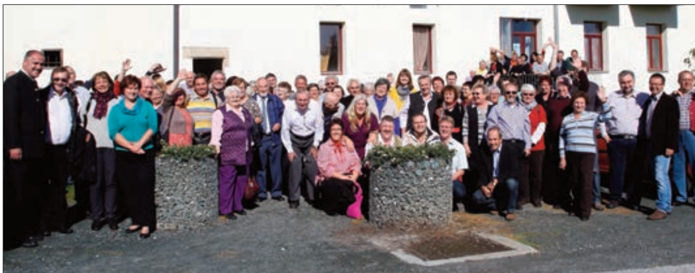
Vor fünf Jahren reisten 111 Burgauer nach Burgau in die Steiermark, um dort um das 30-jährige Jubiläum