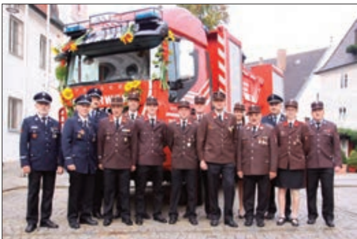
Regelmäßige Besuche und Gegenbesuche festigen die Partnerschaft. Beim 150-jährigen Jubiläum der Freiwilligen Feuerwehr Burgau war auch eine Delegation der Freiwilligen Feuerwehr Burgau-Burgau vertreten.