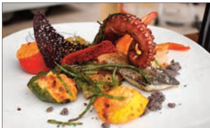
Gegrilltes Wolfsbarschfilet, Pulpo, Riesengarnelen und Jakobsmuscheln an getrüffeltem Kartoffelpüree.