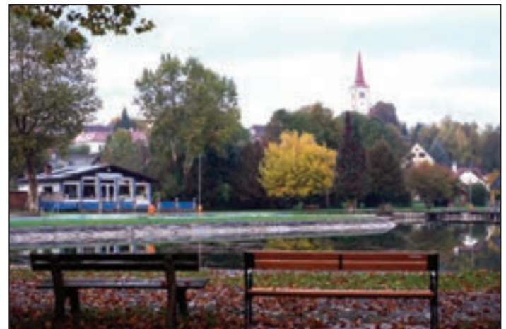
Seit 35 Jahren besteht die Partnerschaft mit der Marktgemeinde Burgau in der Steiermark. Das Bild zeigt das Schlossbad und die Wallfahrtskirche Maria Gnadenbrunn beim Besuch vor fünf Jahren.