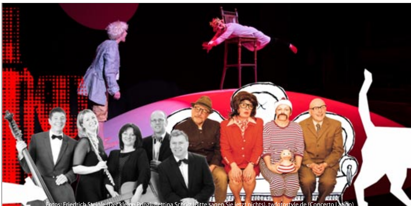
Fotos: Friedrich Steinle (Der kleine Prinz), Bettina Schulz (Bitte sagen Sie jetzt nichts), twfotostyle.de (Concerto Latino)